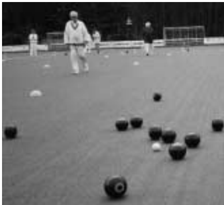
Een "close end".

kunstgras of op tapijten die in een sport-hal worden uitgerold.