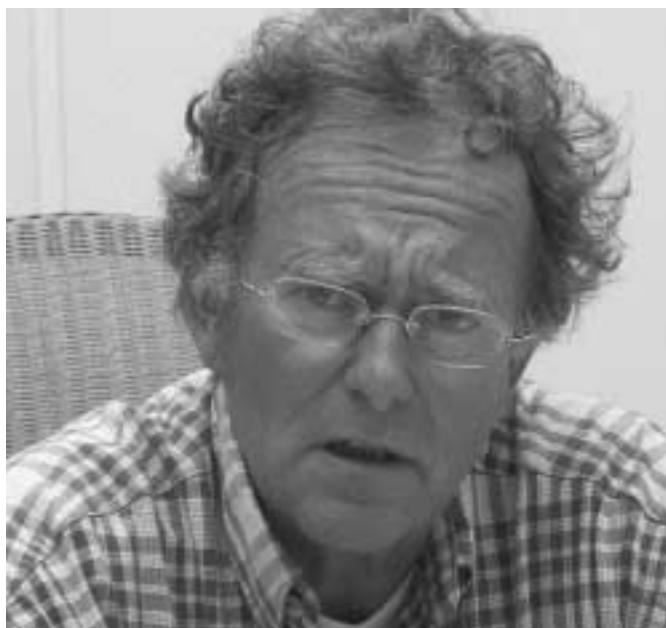
“Voor ons gelden de waarden en normen, die wij ook voor onszelf aanleggen”.

Het ontstaan van de Commissie Evenementen voert ons ongeveer tien jaar terug. Het