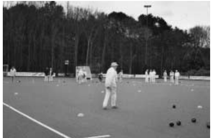
Overzicht van het spel.

De BBC zendt enkele malen per jaar op de middag reportages uit van internationale singles kampioenschappen op binnenbanen. De resultaten zijn soms millimeterwerk! Maar daarop hoeft u niet te wachten. Het spel wordt in de open lucht, zomer en