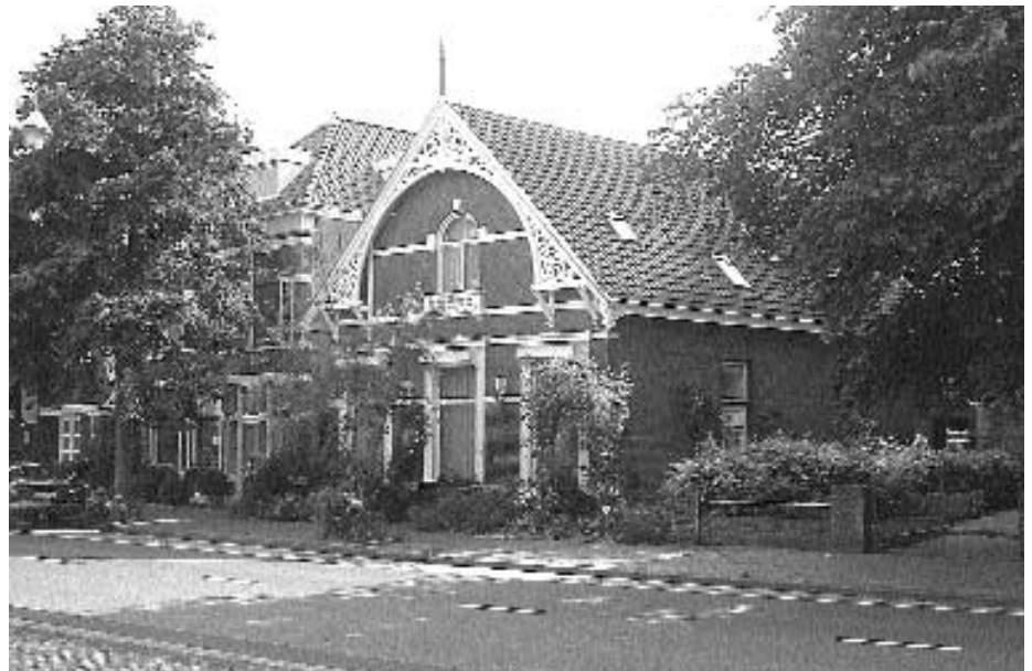
Badhuisweg 179: ooit het oude boswachtershuis en ooit midden in het groen zonder enige bebouwing rondom.

Terug in Nederland ontplooiden Andriessen zich als een veelzijdig componist. Naast orkest- en kamermuziek componeerde hij muziek voor toneel, film, radio en later ook voor televisie. Hij kreeg vele opdrachten voor het componeren van werken voor speciale gelegenheden. Respiration Suite voor